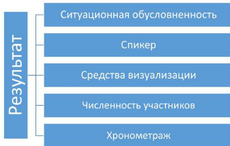
Рис. 5. Факторы результативности вербальных профилактических мероприятий

Применительно к временным показателям проведения мероприятий оптимальным представляется хронометраж 90 минут, поскольку более длительное мероприятие непременно будет терять зрительский интерес. Также не рекомендуется проводить мероприятия в субботние дни, так как для большинства молодых людей этот день недели является выходным. Основные факторы, влияющие на результативность профилактических мероприятий, представлены на рисунке 5.