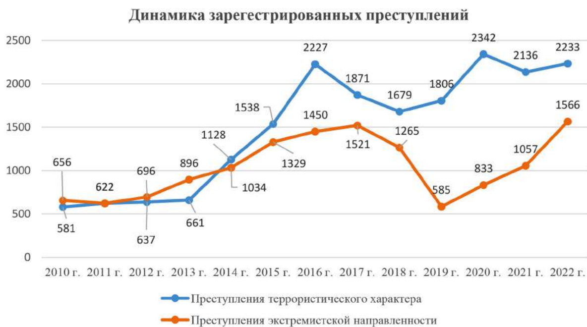
Рис. 1. Динамика преступлений экстремистской и террористической направленности

В этой связи одной из приоритетных задач, стоящих как перед государственными органами, так и перед научным сообществом, является выработка эффективных мер по организации и проведению комплексной работы в области профилактики радикализации российской молодежи и недопущения инспири-