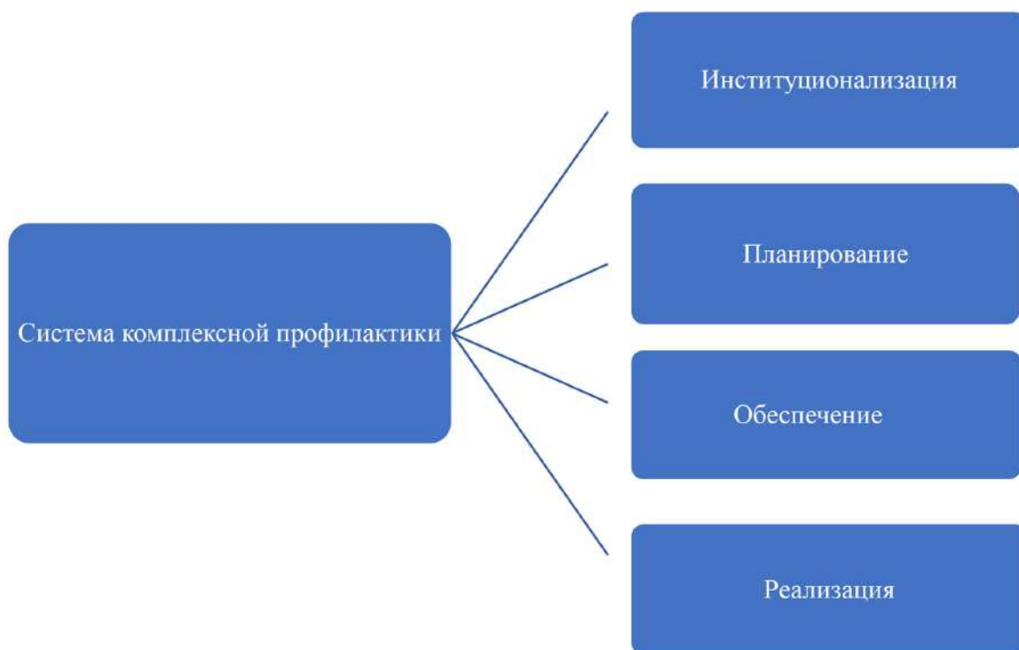
Рис. 2. Система комплексной антитеррористической профилактики

Целью настоящих методических рекомендаций является формирование и совершенствование комплексной работы по профилактике идеологии терроризма и экстремизма среди молодежи через призму ситуационного подхода, предполагающего своевременное, адресное и рациональное использование различных форм профилактического воздействия (рис. 2).