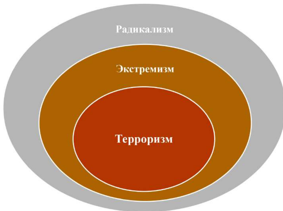
Рис. 3. Соотношение категорий терроризма, экстремизма и радикализма через призму кругов Эйлера