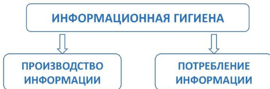
Рис. 1. Векторы применения информационной гигиены

Исходя из поставленной задачи, целесообразно дать следующее определение: информационная гигиена — это совокупность компетенций, позволяющих обеспечить безопасность взаимодействия индивида с информационной средой и направленных на формирование умений и навыков осознанного и ответственного потребления и производства (распространения) информации.